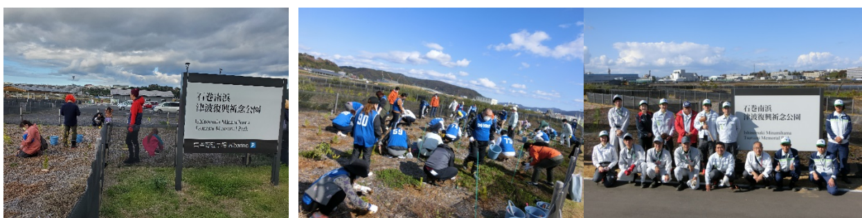
NEXCO 東日本への協力 11/5